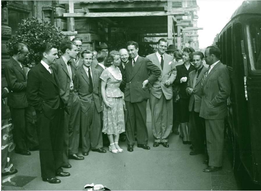
Pitämättä jääneet olympialaiset 1940 ja olympialaiset 1952 kiinnostivat kansainvälistä lehdistöä. 1930-luvun lopulla hotelli KÄMP toimi lehdistökeskuksena, jossa ulkoministeriön sanomalehti-osaston päällikkö Heikki Brotherus toimi ulkomaisten lehtimiesten vierailujen organisaattorina. Kuvassa ulkomaalaisia sanomalehtimiehiä Helsingissä vuonna 1948.